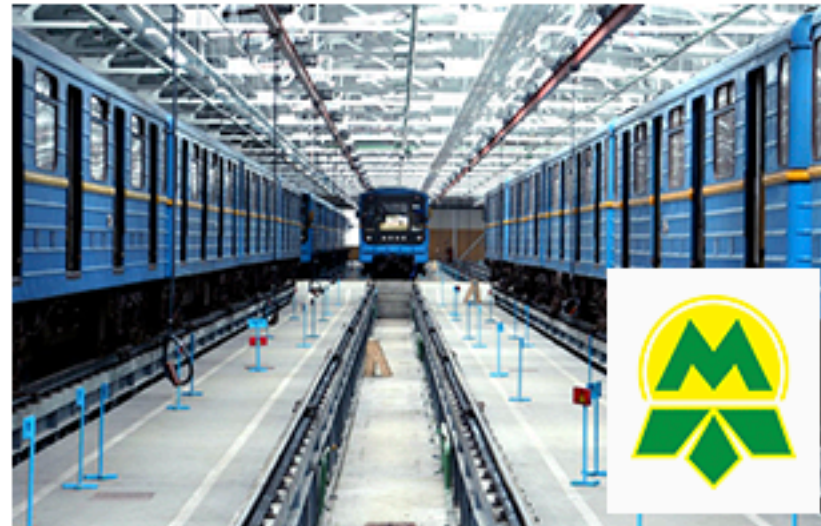
Київський метрополітен. Площа об'єкта більше 60 000 м 2