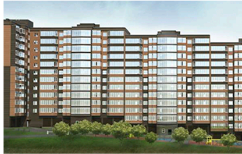
ЖК Преміум Парк, Житомир. Площа об'єкта 6 080 м 2