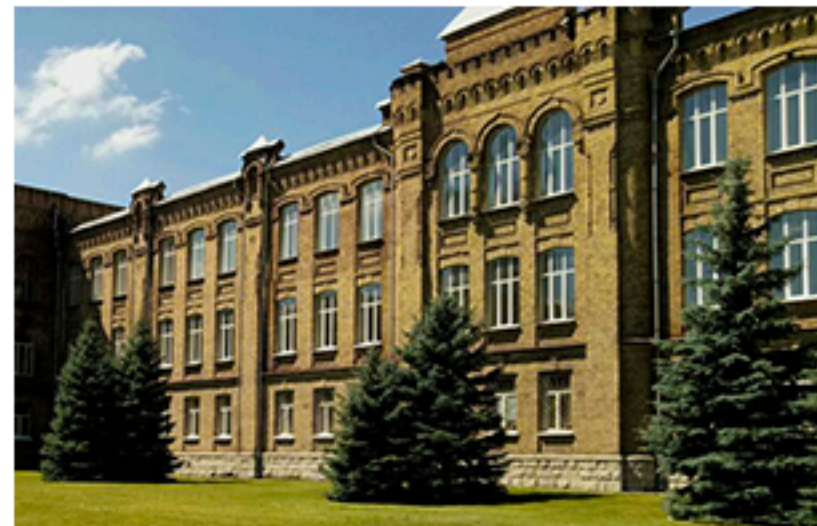
Вищий спеціалізований суд України, Київ. Площа об'єкта більше 27 470 м 2