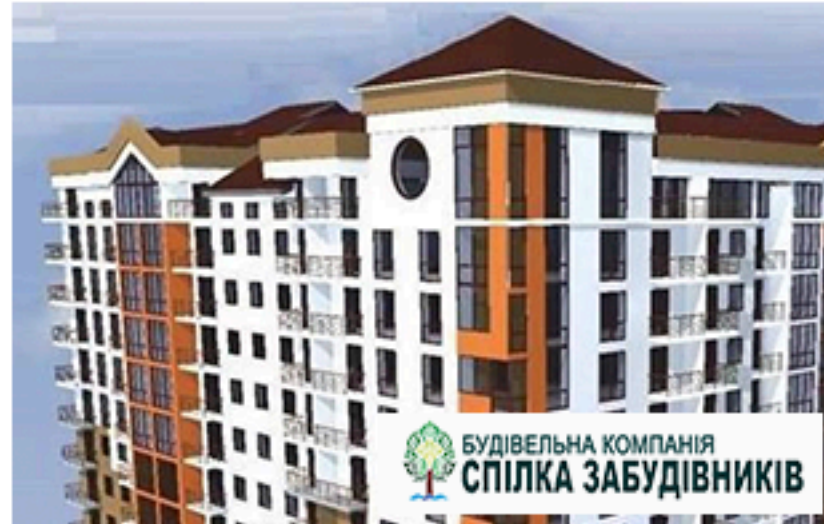
ЖК Парковий, Івано-Франківськ. Площа об'єкта 18 000 м 2