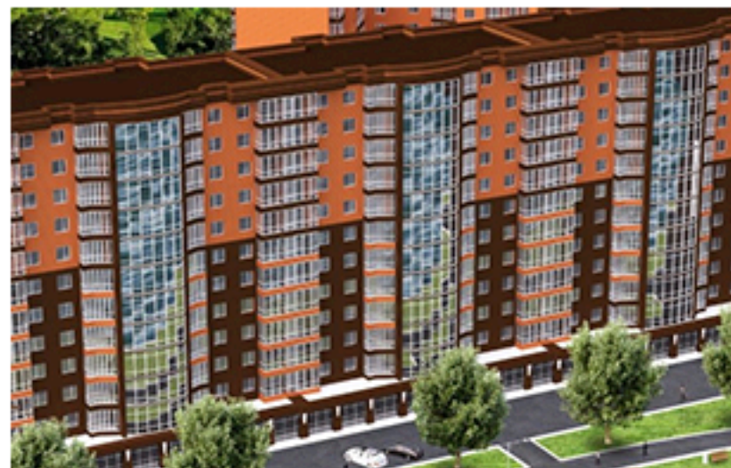
ЖК Ріверсайд, Рівне. Площа об'єкта 5 879 м 2