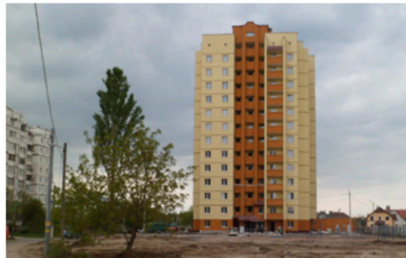
Масив Народицький, Житомир. Площа об'єкта 6 000 м 2