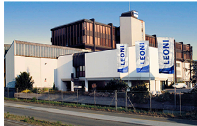
Завод «Leoni», Коломия. Площа об'єкта 13 740 м 2