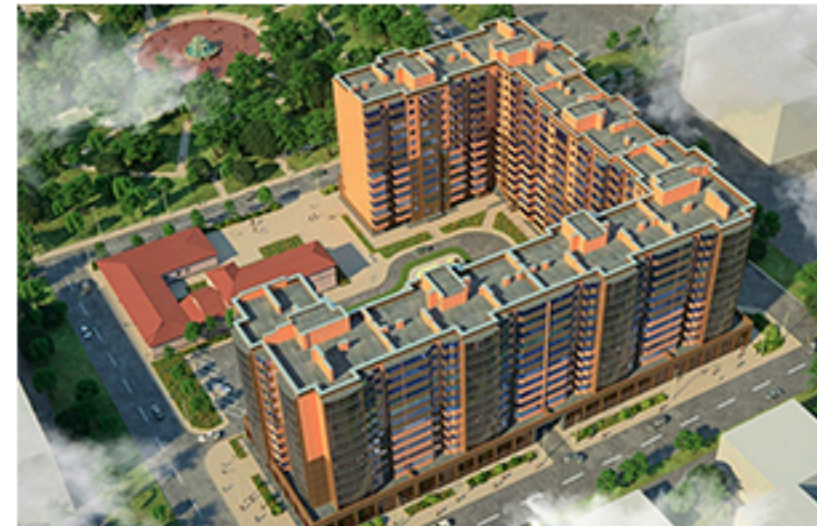
ЖК Ковалевський, Кропивницький. Площа об'єкта 6 840 м 2