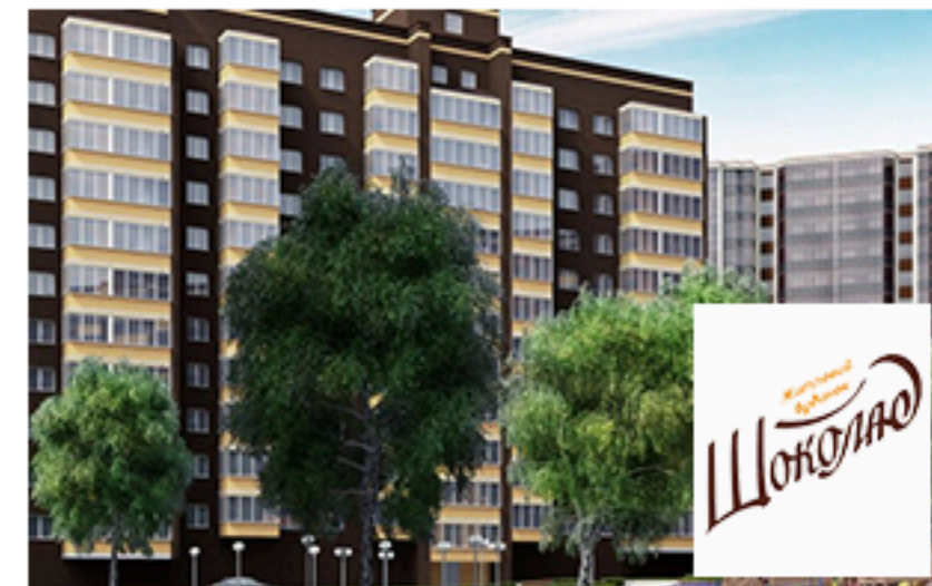
ЖК, Шоколад, Рівне. Площа об'єкта 6 579 м 2