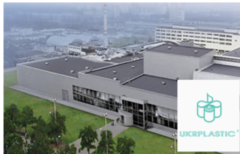
ПАТ «Укрпластик», Київ. Площа об'єкта 10 475 м 2