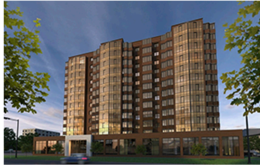
ЖК Симфонія, Черкаси. Площа об'єкта 8 000 м