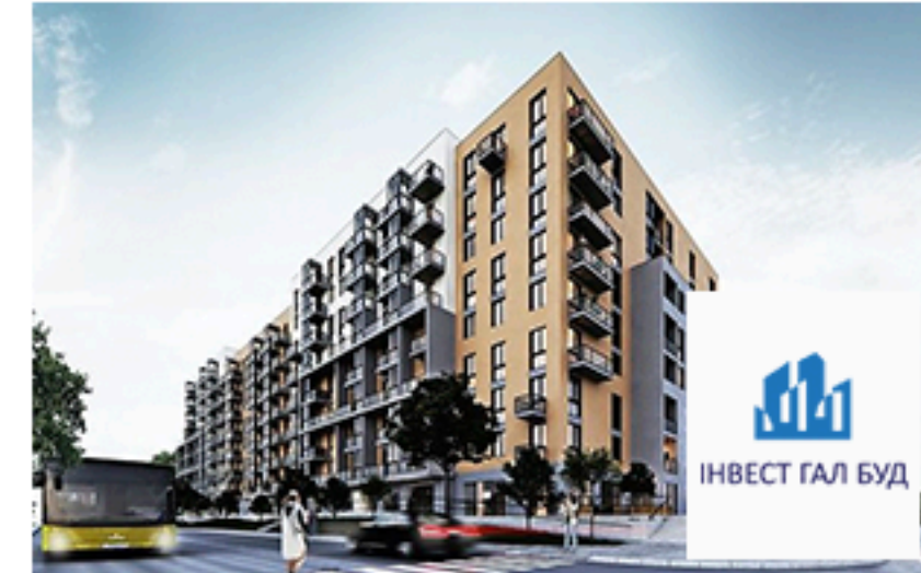
ЖК Львівський квартал, Стрий. Площа об'єкта 3 775 м 2