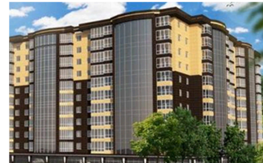
ЖК Рівер Таун, Харків. Поквартирні технічні паспорти.