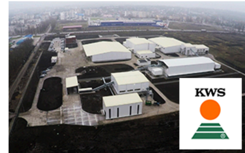
Завод КВС-Україна, Кам'янець-Подільський. Площа об'єкта 37 528 м 2