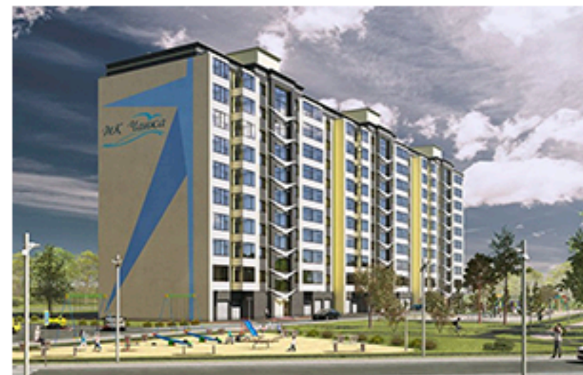
ЖК Чайка, Одеса. Площа об'єкта понад 15 000 м 2