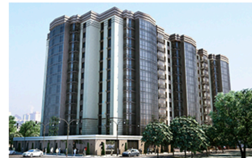
ЖК, Атлант, Чернівці. Площа об'єкта 7 900 м 2