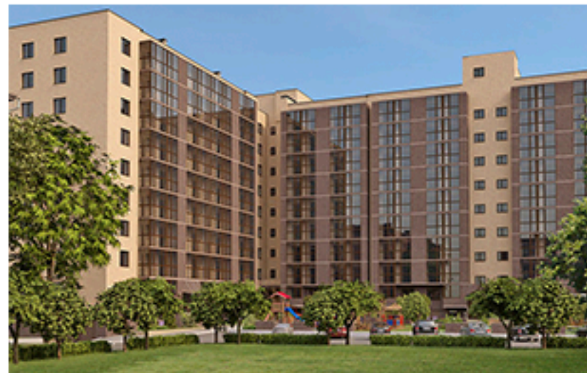
ЖК Атмосфера, Дніпро. Площа об'єкта 15 601 м 2