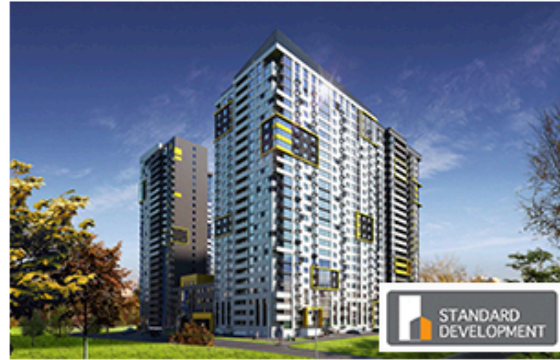
ЖК Кампус від Стандарт Девелопмент. Площа об'єкта 43 607 м 2