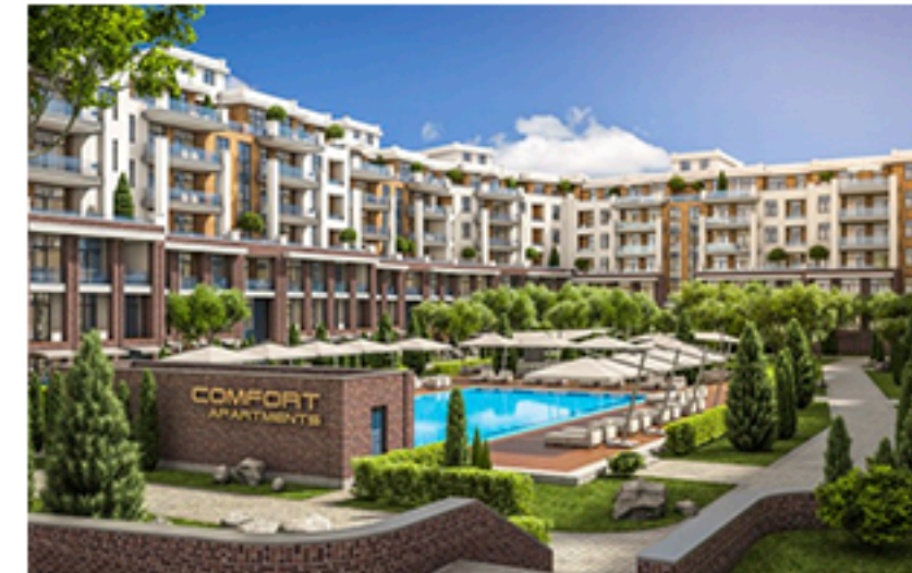
ЖК Комфорт сіті, Дніпро. Площа об'єкта 12 348 м 2