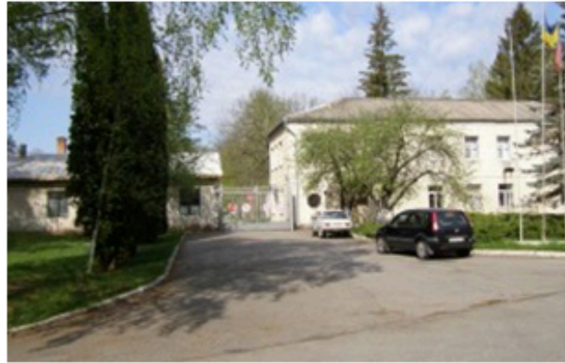
ДО Комбінат «Рекорд», Житомир. Площа об'єкта 3 749 м 2