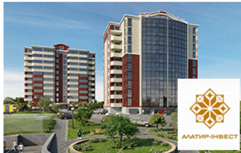
ЖК Оберіг, Вараш. Площа об'єкта 3 965 м 2