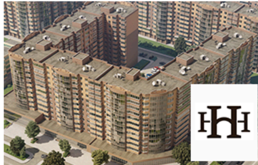
ЖК Набережний квартал. Площа об'єкта 25 000 м 2