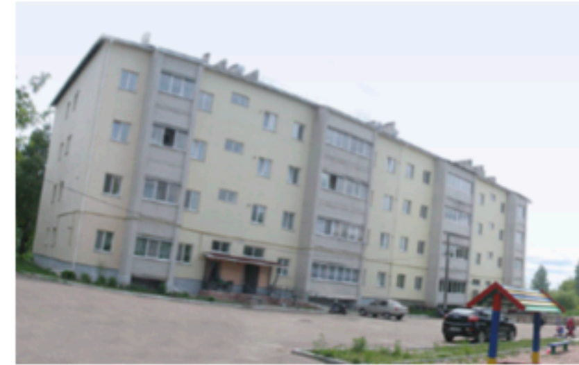
Житловий будинок для прикордонників, Овруч. Площа об'єкта 4 317 м 2