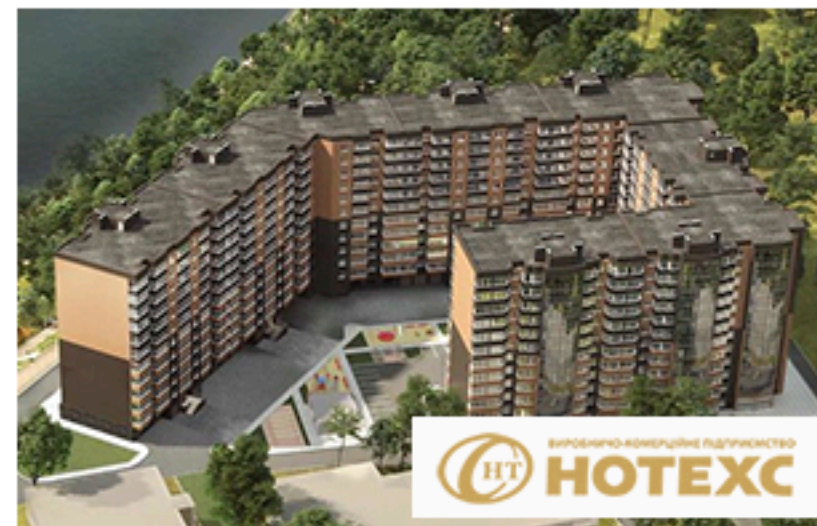
ЖК Зарічний, Суми. Площа об'єкта більше 7 000 м 2