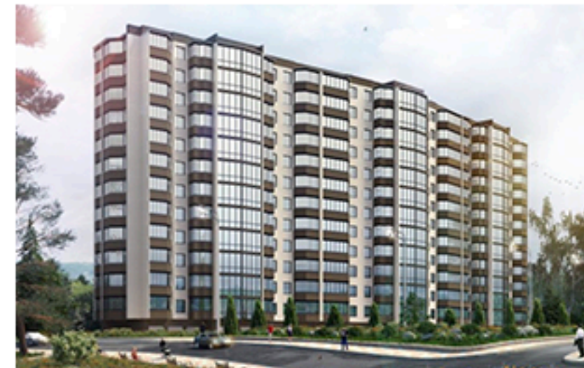
ЖК Тетерівський бульвар, Житомир. Площа об'єкта 6 495 м 2