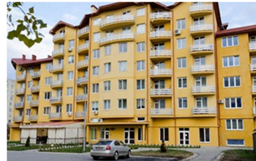
ЖК Сакура, Ужгород. Площа об'єкта 1 768 м 2