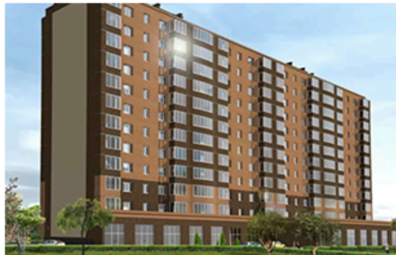
ЖК Капучіно, Житомир. Площа об'єкта 5 671 м 2