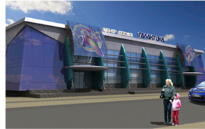
ТРЦ «Галактика» Жовті води. Площа об'єкта 3 582 м 2