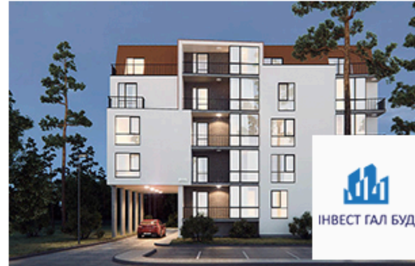
ЖК Інвест Гал Буд, Моршин. Площа об'єкта 1 900 м